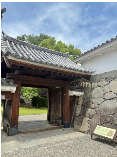
甲府城跡（舞鶴城公園） 山梨県甲府市丸の内1丁目5-4