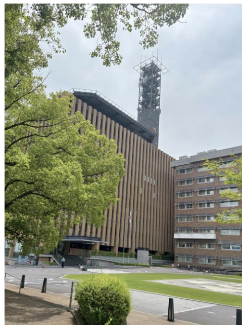
山梨県防災新館 山梨県甲府市丸の内1丁目6-1