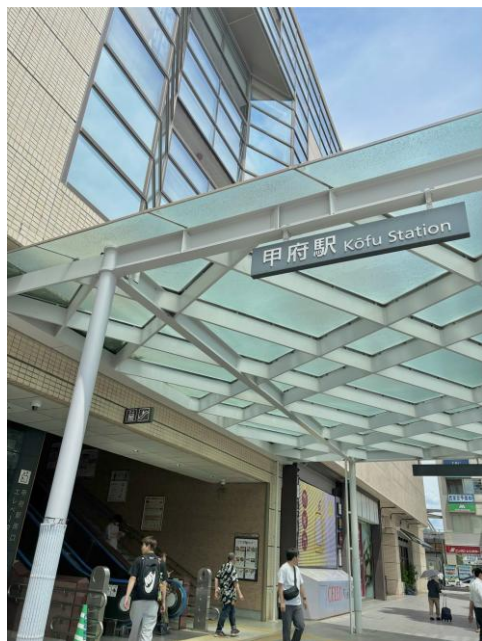
甲府駅 山梨県甲府市丸の内1-1

夜には、参加者同士の交流の場もあり、繁華街として栄える甲府の活気も味わうことができました。短い出張ではありましたが、甲府を歩き、講演を聞き、まちづくりに触れることで、建設会社として地域に関わることの大切さを改めて感じる一日となりました。